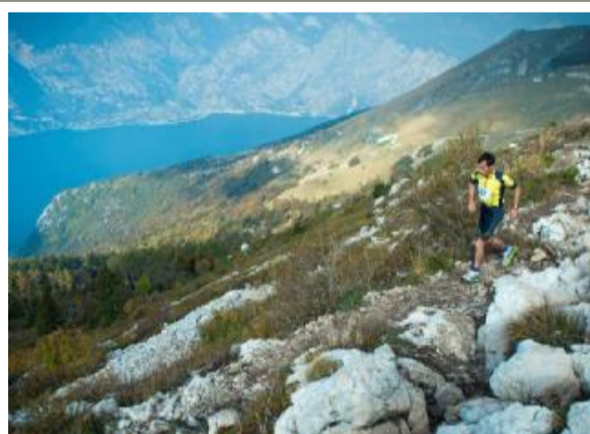
Un passaggio di una delle edizioni precedenti della Mountain Race