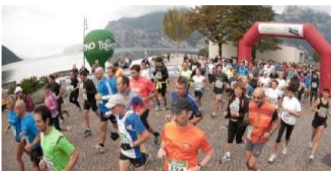
Lake Garda Marathon, nona edizione al via da Malcesine

te delle istituzioni di promozione del comprensorio gardesano, prima di vedersi riconoscere un valore che all'estero viene pienamente compreso».