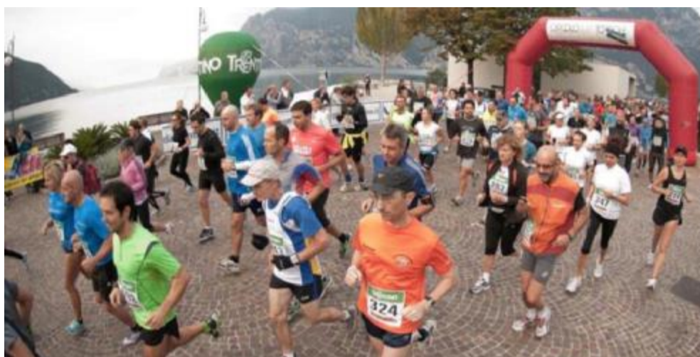
La partenza di una delle edizioni dell'International Lake Garda Marathon

Sono riconfermate le distanze di 15 chilometri («Lake Garda Run»), 30 chilometri («Lake Garda Long Run») e della distanza olimpica (42,195 km) mentre si aggiunge una nuova gara in notturna il sabato sera precedente la gara con partenza da Torbole verso il sentiero panoramico delle Busatte con ritorno alla partenza. La caratteristica è di un'«alta via» panoramica (filmato sul sito www.lakegardamarathon.it ) che avrà probabilmente una classifica combinata con la «15 chilometri» come «Torbole Night Run»: la partenza sarà sul lungolago, dove arriverà il giorno dopo la maratona, durante il party che accoglierà i runner